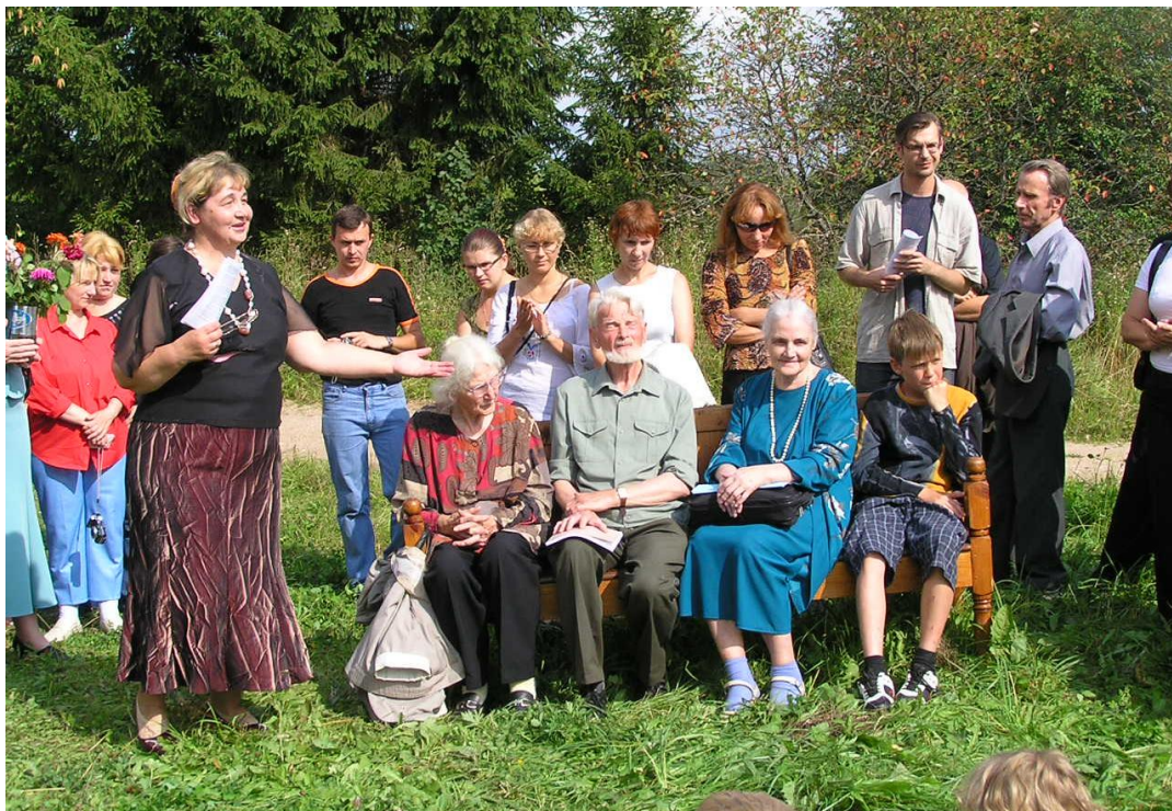
Участники Бианковских чтений в дер. Михеево (Мошенской р-н), 2007 г.