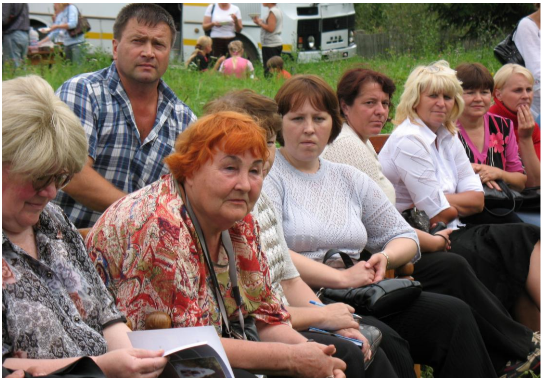
Участники Бианковских чтений в дер. Михеево (Мошенской р-н), 2007 г.