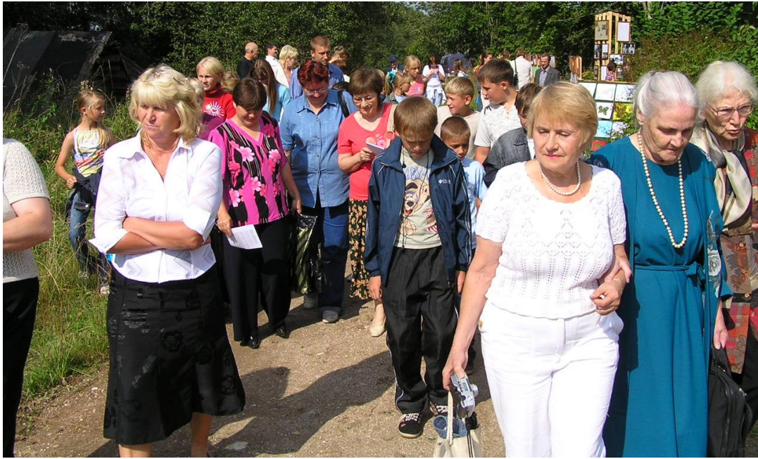
Участники Бианковских чтений в дер. Михеево (Мошенской р-н), 2007 г.