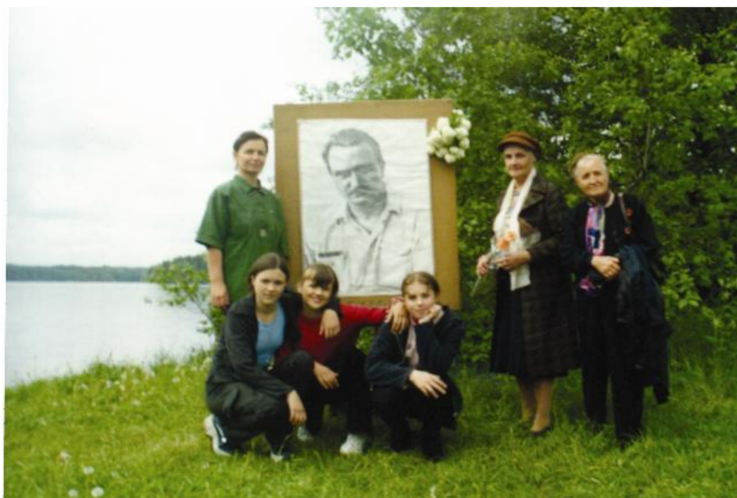
Участники Бианковских чтений на Боровно, 1999 год.