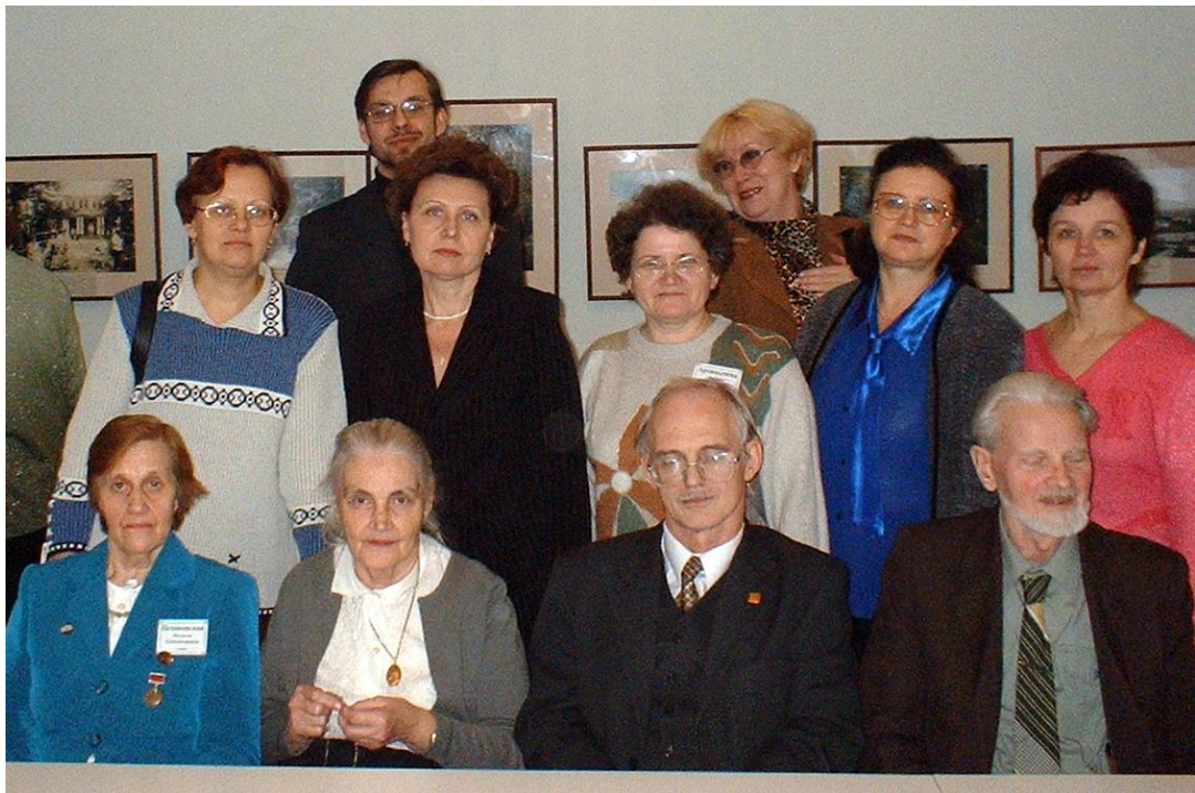
Участники конференции "В. Бианки - писатель, ученый, педагог", второй день. г. В.Новгород, 15.02.2005 г.