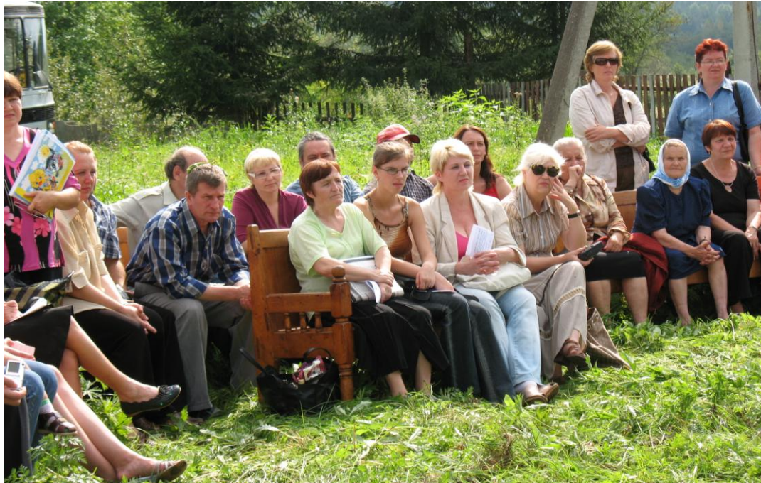
Участники Бианковских чтений в дер. Михеево (Мошенской р-н), 2007 г.