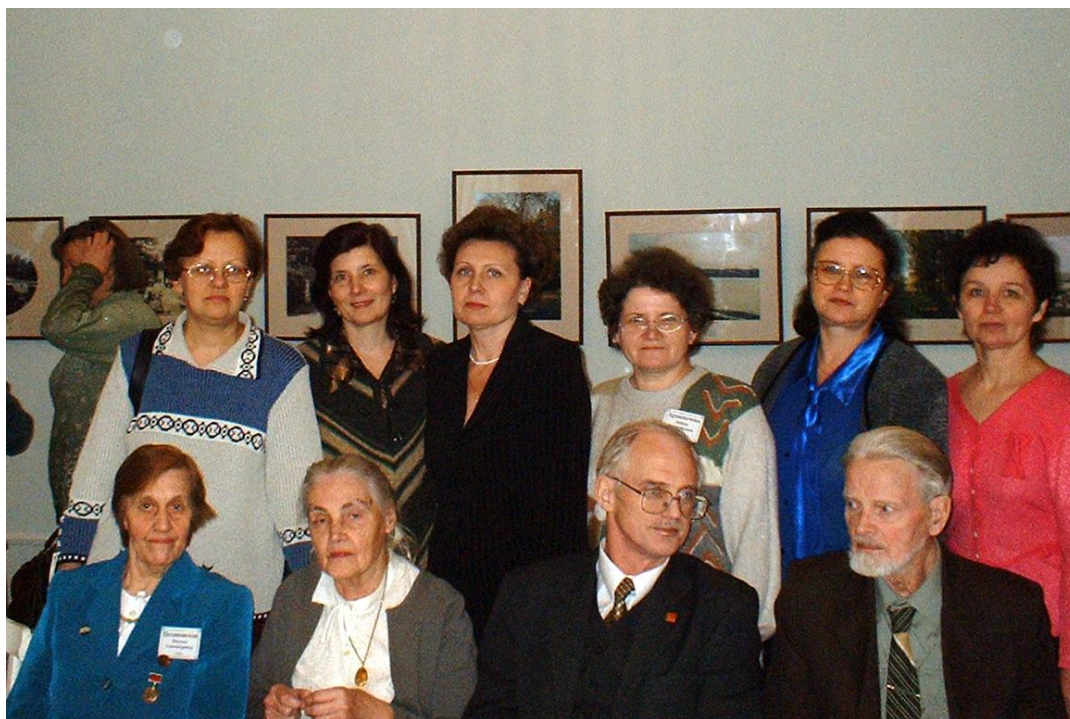
Участники конференции "В. Бианки - писатель, ученый, педагог", второй день. г. В.Новгород, 15.02.2005 г.