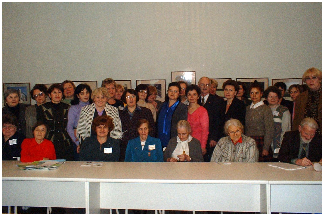
Участники конференции "В. Бианки - писатель, ученый, педагог", второй день. г. В.Новгород, 15.02.2005 г.