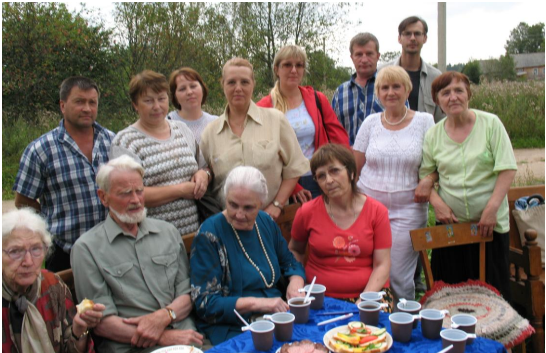
Традиционное угощение. Бианковские чтения в дер. Михеево (Мошенской р-н), 2007 г.