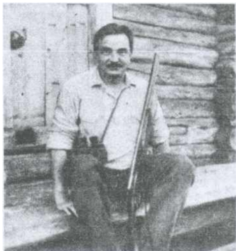
Михеево. Перед выходом в лес. Фото 1940 года

Следующее лето — 1937 года — мы живём в другой деревне — Михееве, в трёх километрах от Яковищ, ближе к станции Хвойная, там же прожили ещё несколько лет до 1942 года. Речка там та же — Удина. Деревня маленькая, рядом два озера, которые отец назвал