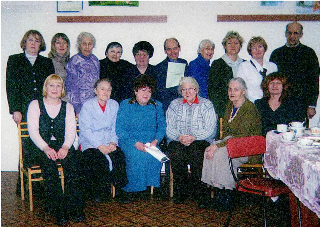
Почётные гости Недели Бианки-2004 в центральной детской библиотеке им. В. Бианки.