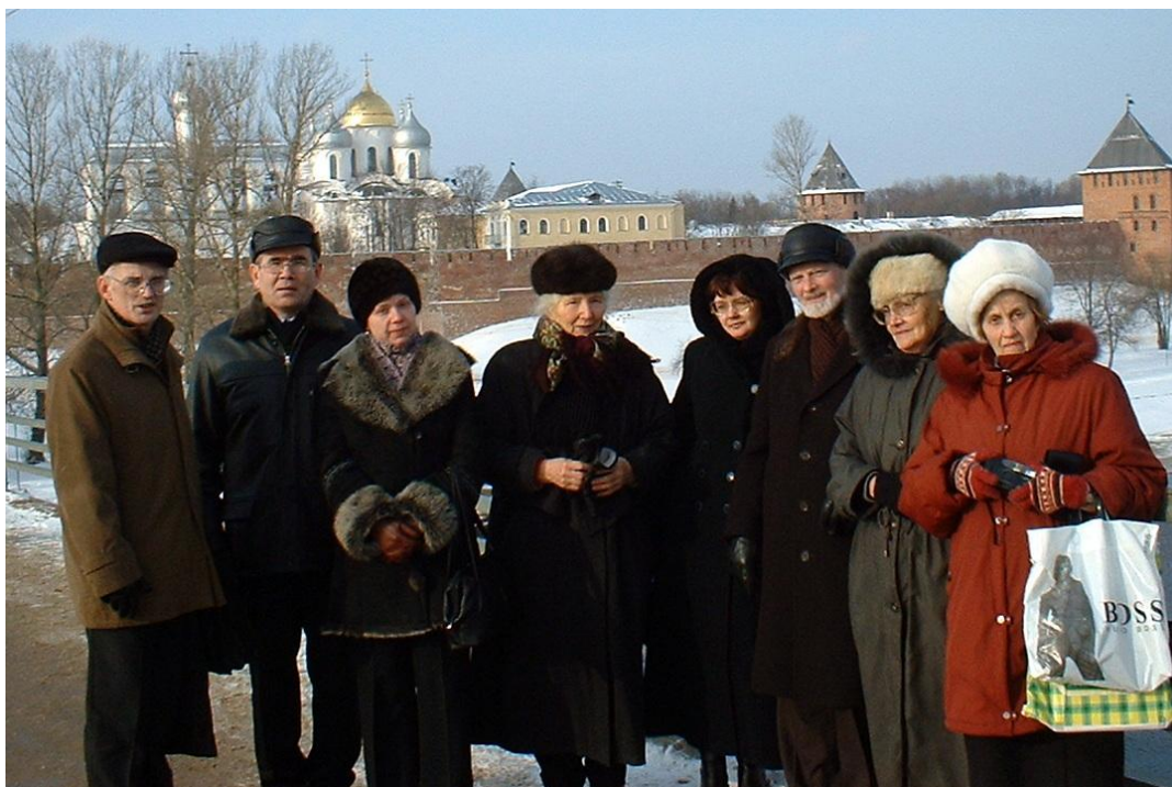
Иногородние участники конференции "В. Бианки - писатель, ученый, педагог" на прогулке. В. Новгород, 15.02.2005 г.