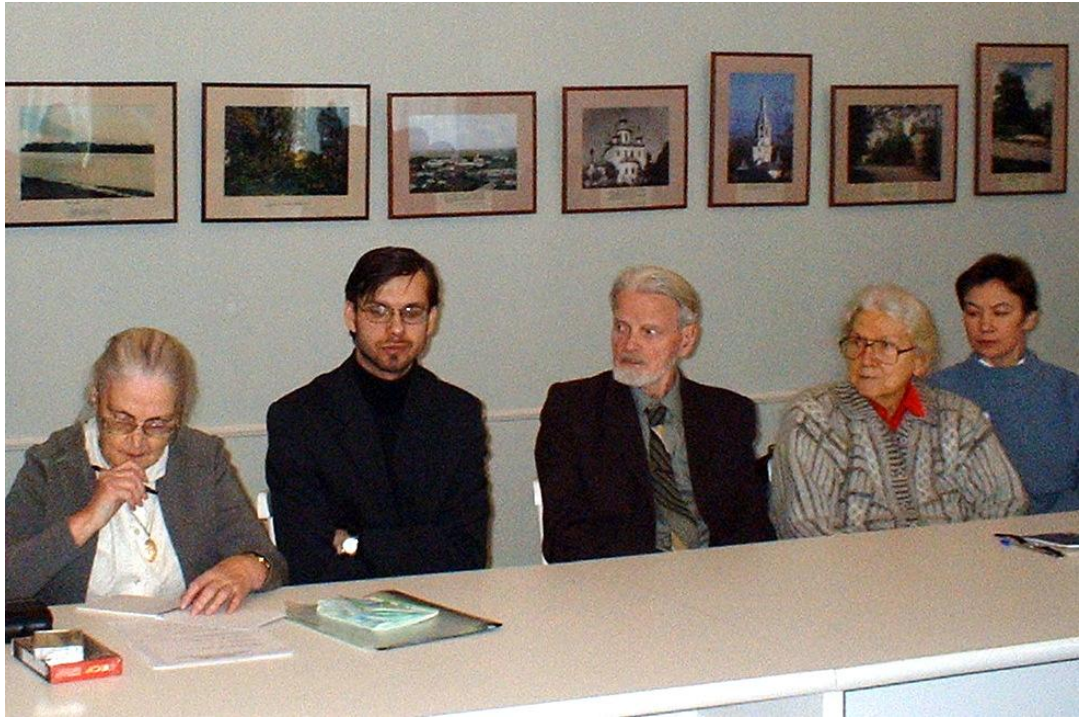
Участники конференции "В. Бианки - писатель, ученый, педагог", второй день. г. В.Новгород, 15.02.2005 г.