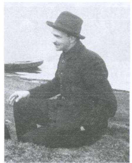
У Волхова. Виталий Валентинович Бианки. 1928 год

Не оставлял письменного стола Виталий Бианки в Слутке: продолжал писать начатую в