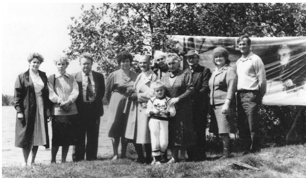
Делегация Валдайского национального парка на VIII Бианковских чтениях. оз. Боровно. 1991 г.